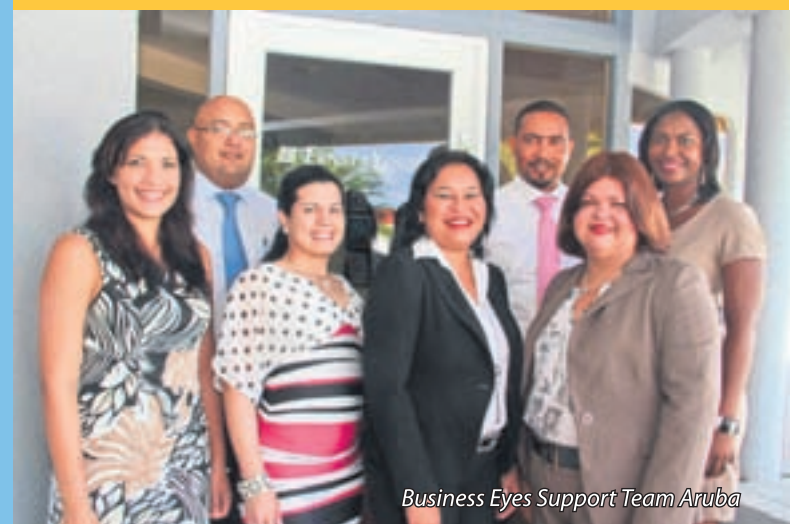
Business Eyes Support Team Aruba

Introduction Seminar Wednesday 23rd of May 2012